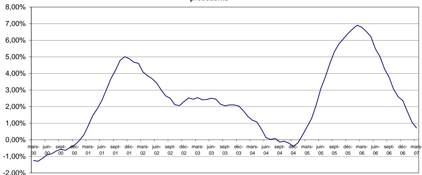
Graphique 4 : Rapport de l'indice moyen des 12 derniers mois sur l'indice moyen des 12 mois précédents

L'inflation annuelle qui est la moyenne des indices des 12 derniers mois (avril 2006 à mars 2007) par rapport à celle des 12 mois précédents (avril 2005 à mars 2006) donne une hausse de 0,7% contre une hausse de 6,8% en mars 2006.