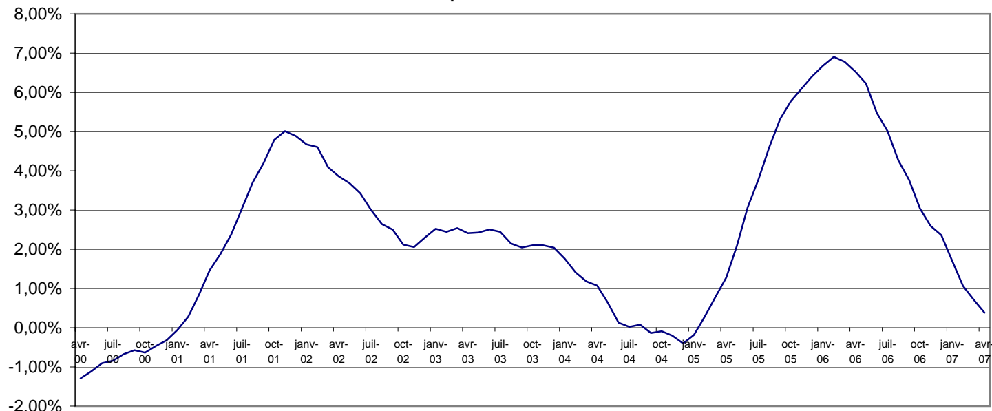
Graphique 4 : Rapport de l'indice moyen des 12 derniers mois sur l'indice moyen des 12 mois précédents

L'inflation annuelle qui est la moyenne des indices des 12 derniers mois (mai 2006 à avril 2007) par rapport à celle des 12 mois précédents (mai 2005 à avril 2006) donne une hausse de 0,4% contre une hausse de 6,5% en avril 2006.